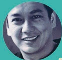
11. 蘇忠興導演 Saw Teong Hin