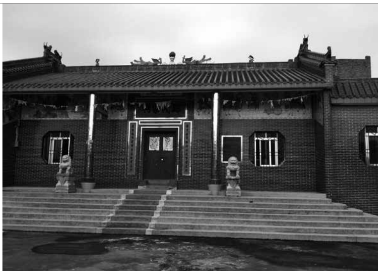
鄭弼靈博士在 2015 年拍攝故鄉廣東遂溪縣的鄭氏宗祠

弼靈弟於 1984 年結婚，有一女一兒，女婿和外孫女。海外奮鬥近四十年，克紹箕裘成功耀眼。他說經常夢會雙親；2013 年母親冥誕時自述，「我抱著媽媽說：好懷念我們大家以前在一起的日子」。所以他亦不辭辛勞地飛萬里航程，趁學術講學訪問之便安排拜謁父母、祖父母安息地：包括台北、香港九龍、廣東廣州（尋找祖父安息地未果）；2015 年 11 月曾來電和照片，說他拜訪了故鄉廣東遂溪平石村舊址，以及鄭氏宗祠（宗祠族譜有祖父、父親諱名）。鄭氏宗