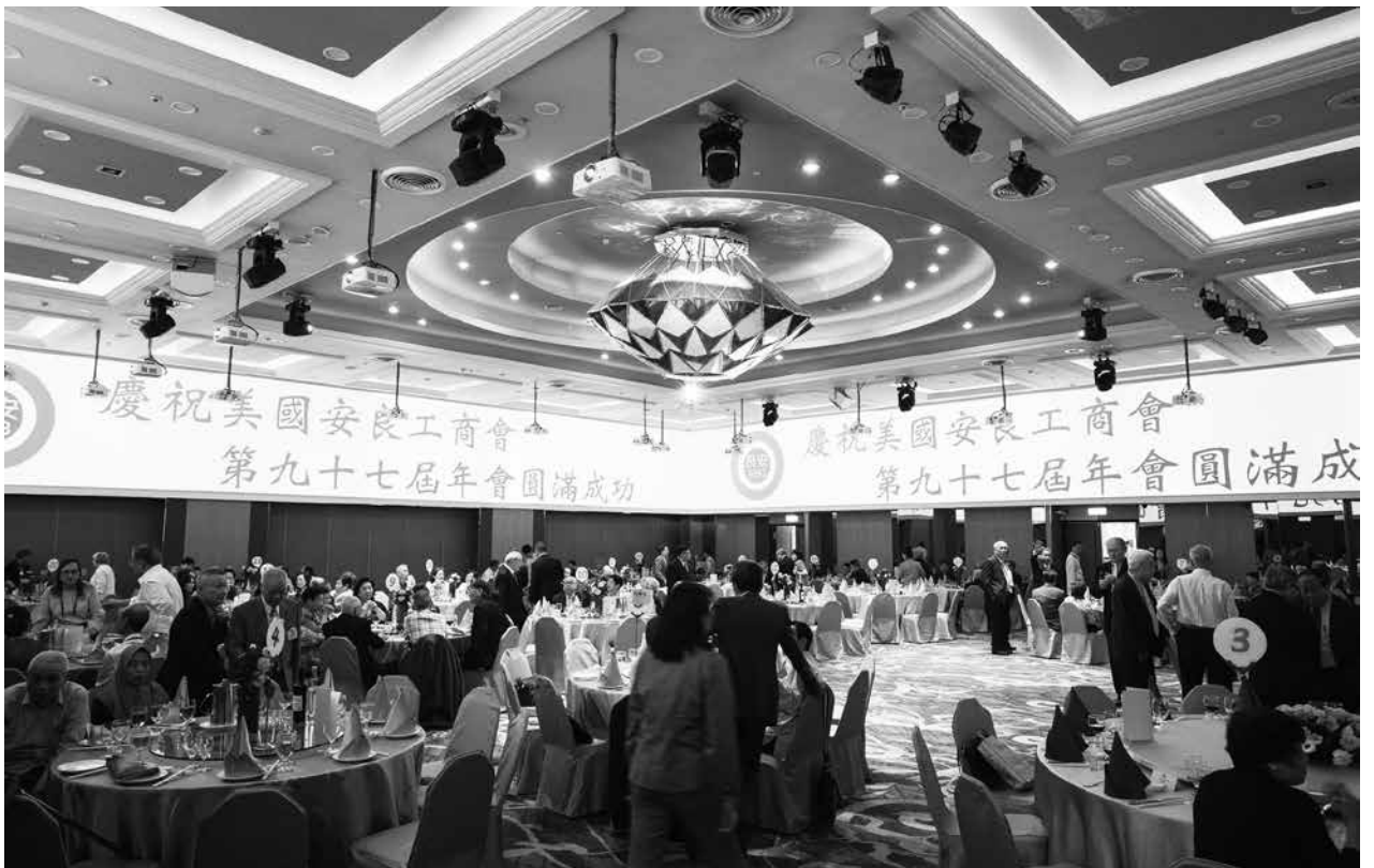
台北市廣東同鄉會慶祝美國安良工商會大會圓滿成功