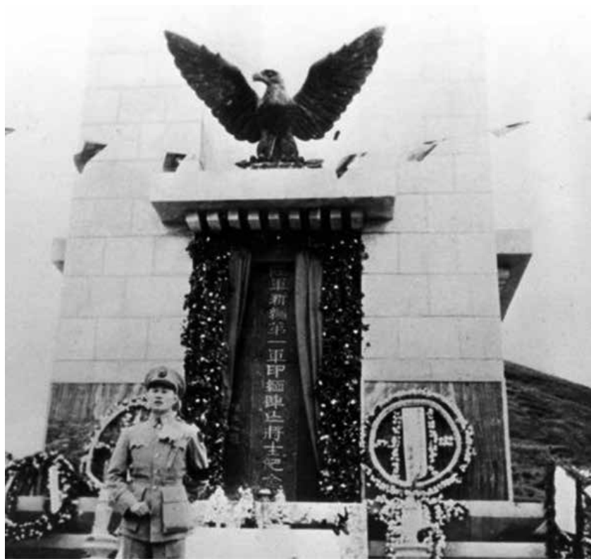
民國卅六年孫立人將軍修建〈中華民國駐印軍陸軍新編第一軍印緬陣亡將士公墓〉竣工揭幕

新一軍袍澤出錢（共耗資法幣7000萬元），於民國卅六年（1947年）4月完工。公墓竣工揭幕後，孫將軍即離開廣州，遠赴台灣訓練新軍。也是他在中國大陸的最後一次公開露面。東、西兩側以及紀念塔根部四周，則鑲嵌著刻有陣亡之新三十八師副師長齊學啟等，以及4543名陣亡將士名字的大理石碑刻。在紀念塔的東側，孫立人為自己