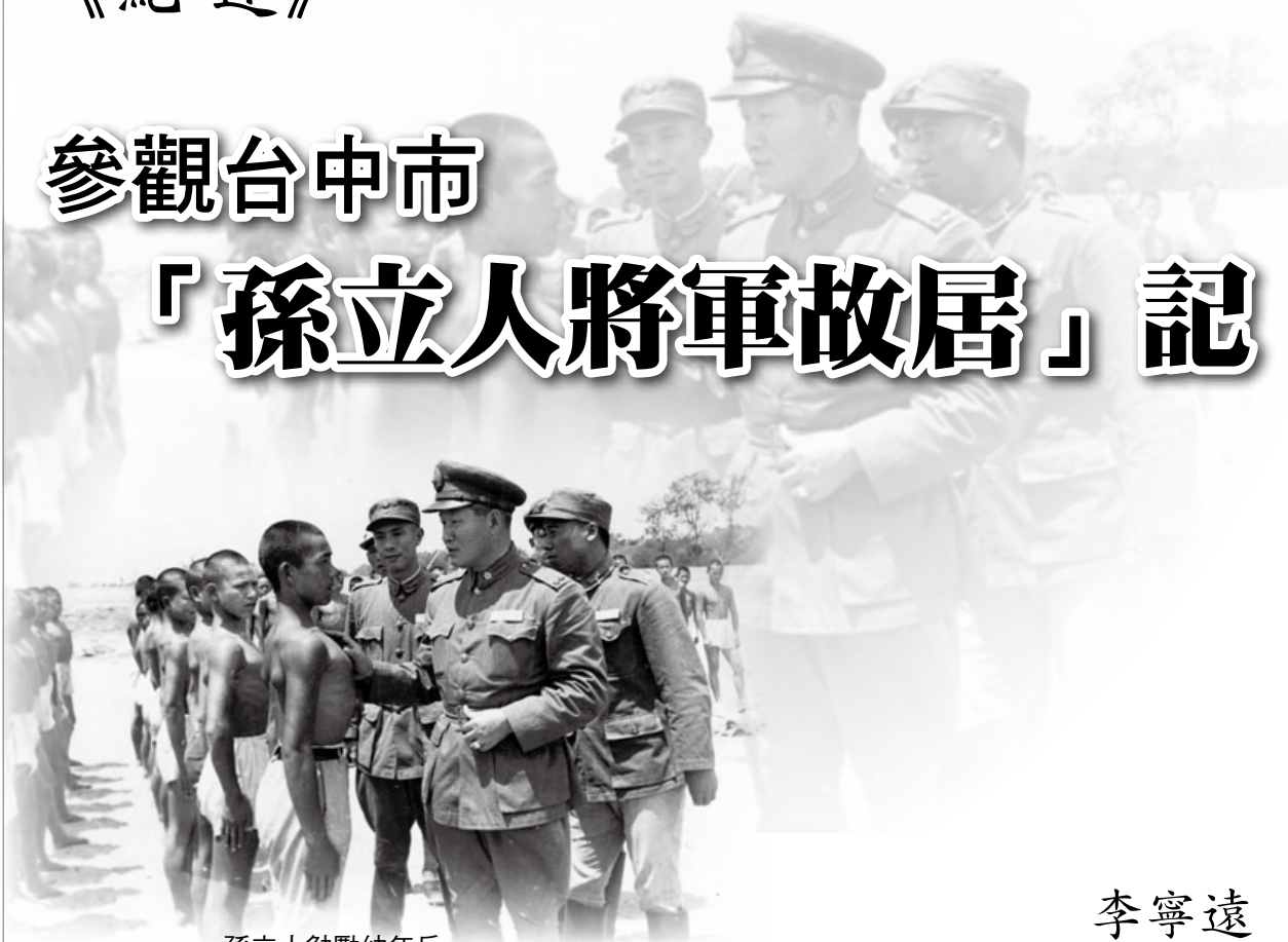
孫立人勉勵幼年兵