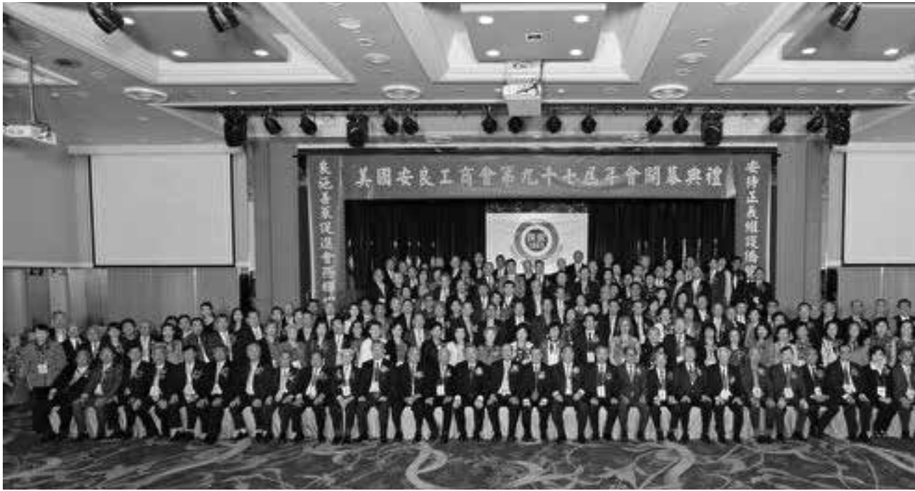
慶祝美國安良工商會成立 125 周年