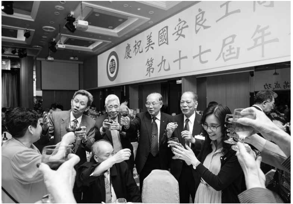
梁理事長（右一）逐桌敬酒致意