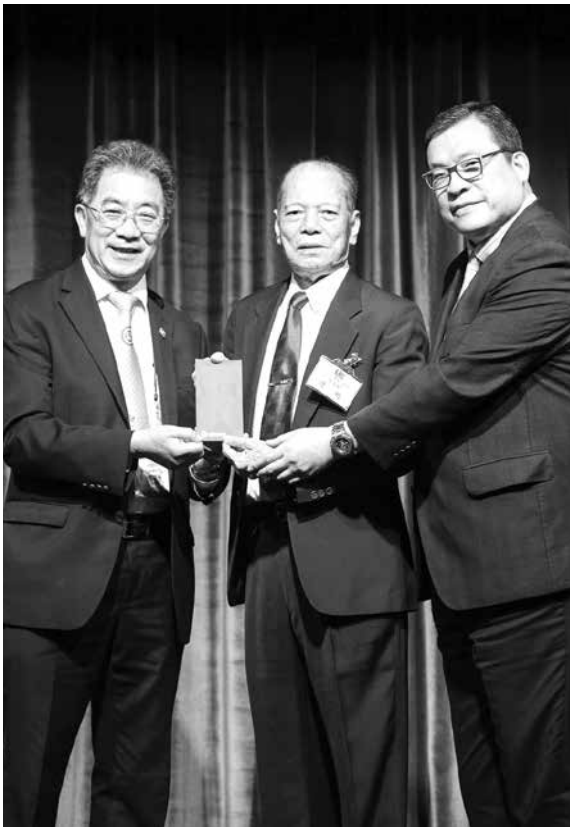
安良工商會樂助本會美金貳仟元