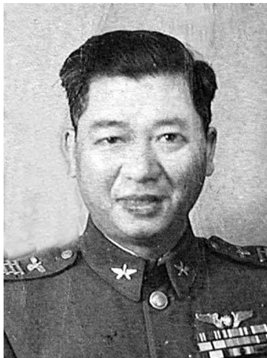
南京空軍總司令部飛行安全處處長 楊仲安將軍

楊仲安將軍生於1906年廣東寶安縣大鵬城，現屬廣東深圳市。幼時看見一架飛機在大鵬灣上低空盤旋呼嘯，驚為天神，立下將來要騁馳長空的宏願，並用鐵針將飛機圖型刺青在左腕處，以明其志。