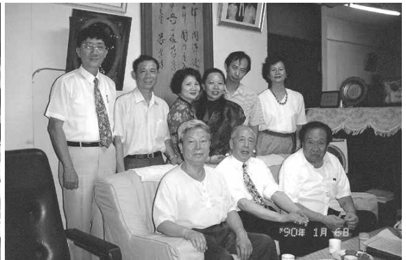
黃友棣與合唱團員