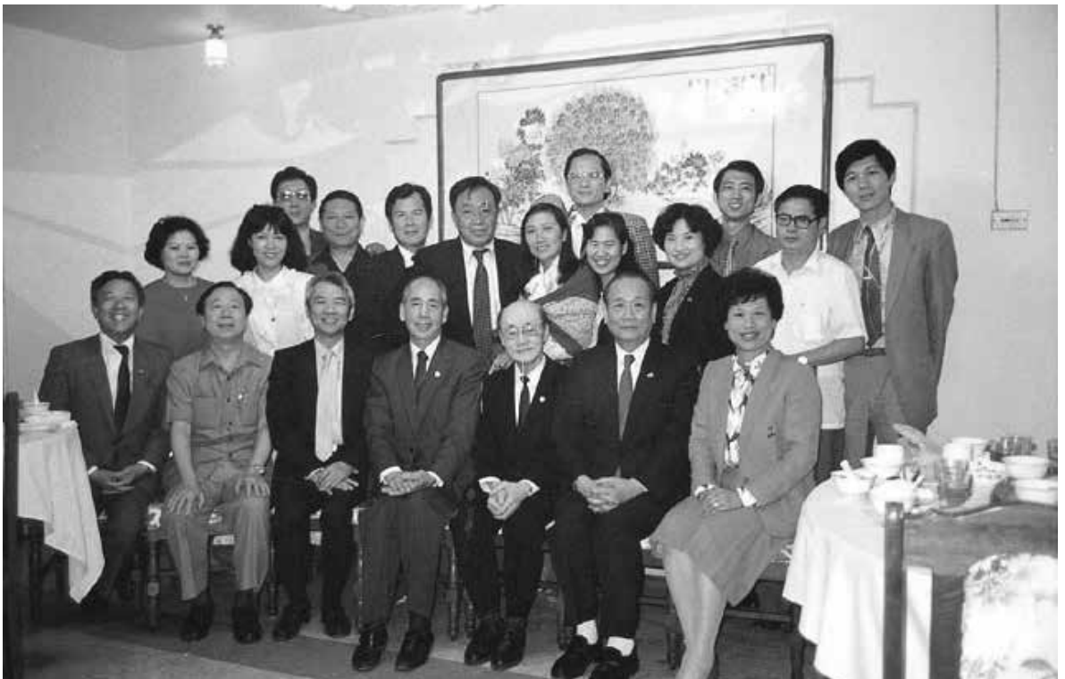
在 1984 音樂節「音樂會友」