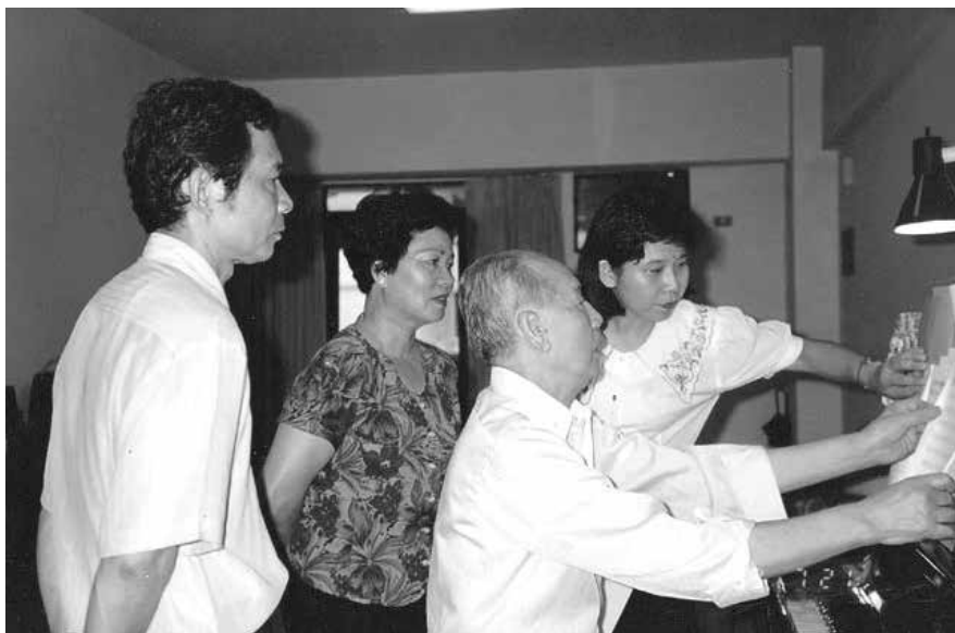
安祥合唱團台北團的團員專程自台北南下高雄向音樂大師黃友棣教授請教如何把每首歌曲的意韻與信息唱出喜悅、安祥、美善的心韻和歡樂的氣息。讓人人感受溫馨；讓社會祥和安樂