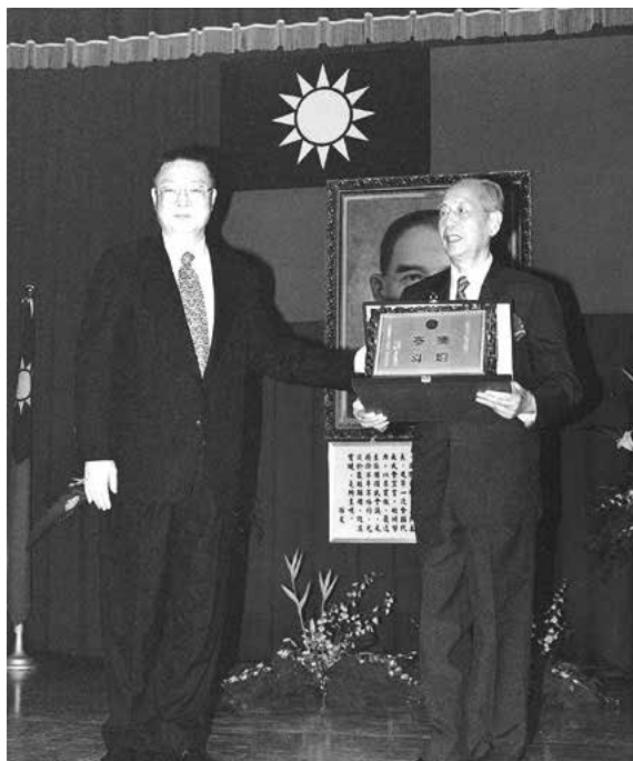
1996 高雄市市長吳敦義頒「傑出樂人獎」