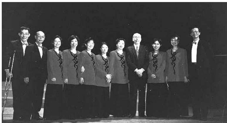
2002-12 「高雄漢聲合唱團」演唱會於高雄文化中心