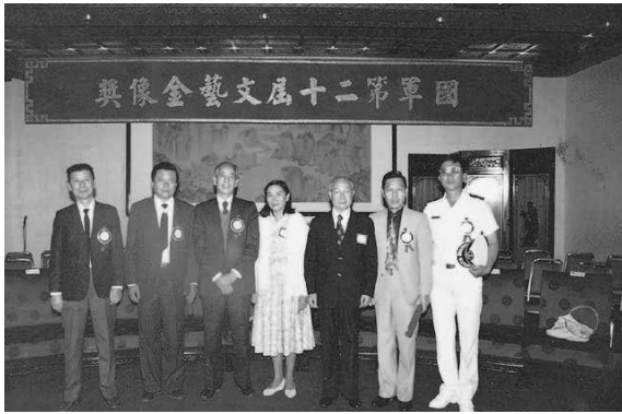
黃友棣與國軍第二十屆文藝金像獎得獎者

位令人欽佩的音樂教育家，他豐盛的作品中好歌與好曲實在太多了。…黃友棣先生雖然離開了香港，選擇高雄為定居之所，但黃友棣先生仍一直非常關懷香港的音樂朋友，他的新作不時給香港音樂界朋友作首次演出，這種為音樂獻出無盡心意，的確令人倍感溫情。」凡是與他相處過的人，應能感同身受這句話的意義，在人際互動的節目單上，他常藉音樂為媒，輸送天涯若比鄰的溫馨。根據香港聲樂家費明儀教授描述，她認為黃老師從1965-1987，在香港主要貢獻有兩方面：一是為古詩詞譜成合唱曲，並且根據「中國風格和聲」理論創作新形式的音詩，如結合女高音朗誦、鋼琴獨奏與合唱的「琵琶行」，當作室內樂來寫，為古詩詞的譜曲做了新嘗試。二是編了超過四十組的聯篇民歌組曲，若沒有對中國文學深厚的涵養是做不好的。我曾問過老師，文學修養這麼好，為何不自己作歌詞？他說