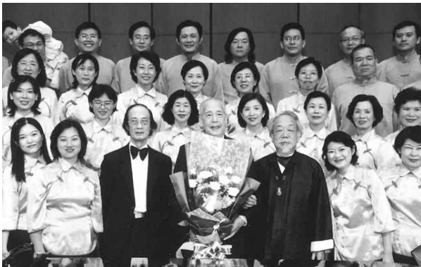
黃教授指導鼓山婦女合唱團