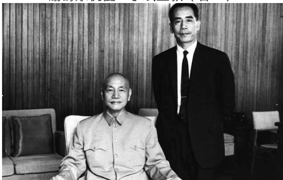
1976年黃友棣教授獲中山文藝獎 蒙蔣公召見