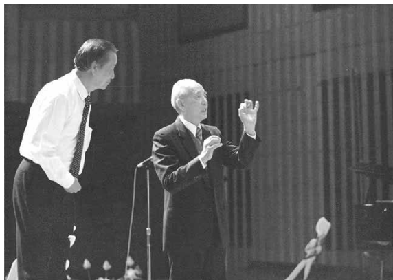
黃友棣於演唱會彩排現場彩排時神情