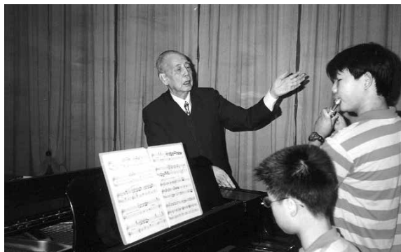
黃友棣於小朋友表演會上為小朋友演奏