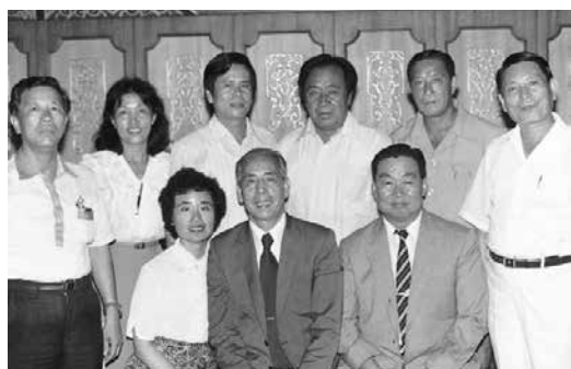
黃友棣與白雲鵬等人合影

觀、懇切、積極，具凝聚力，（指他發起香港音樂界的聚會），流露出領袖才，充沛的創作力，寫作勤，態度認真。優秀的鋼琴演奏技術，學遍全團的樂器演奏法，可惜未逢能善用他知遇。他是個能演奏、能作曲、能指揮、能演講、能著述的全才；對音樂具有使命感，對事情能把握要點，邀同仁合作，同仁莫不樂予協助。