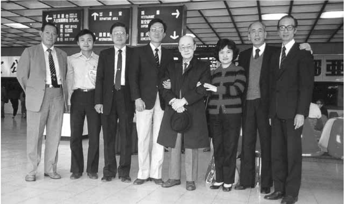
黃友棣於機場與韋瀚章合影